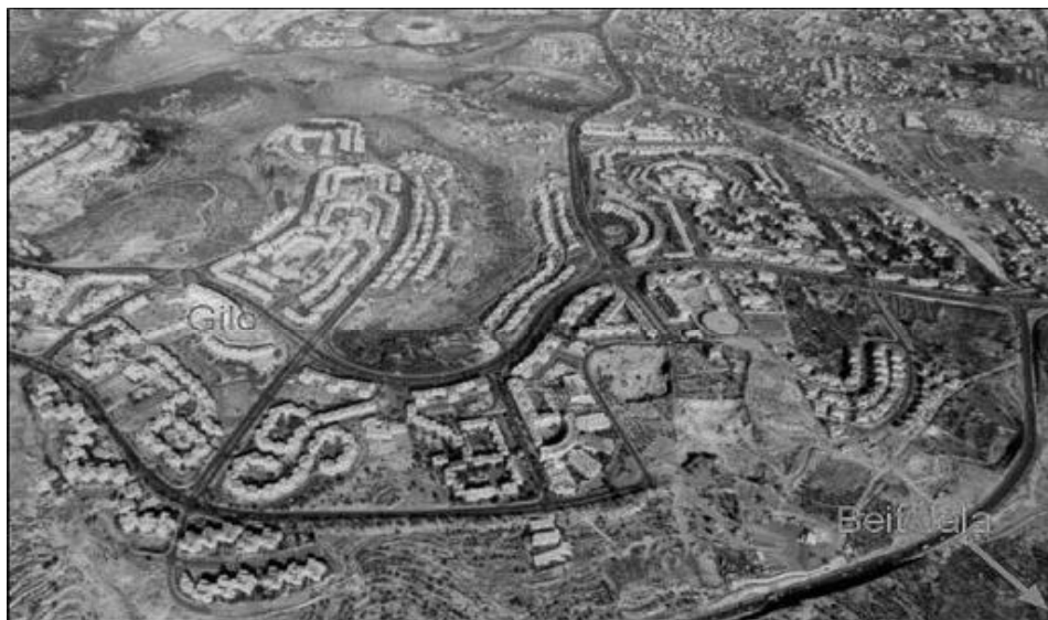
Colonia di Gilo

La divisione fra aree israeliane e palestinesi ora non è più limitata alla superficie del suolo ma diviene verticale . Architetto e urbanista di fama internazionale, Thomas Leitersdorf nel 1978 fu incaricato dal governo Likud di un progetto di insediamento nelle regioni montane della Cisgiordania. Tra le altre cose aveva progettato basi dell'esercito statunitense in tutto il mondo. Progettò 2600 unità abitative secondo il principio militare di collocarle nella posizione che assicurava il miglior controllo. Non furono fatti bandi di gara ma egli stesso affidò i lavori alle compagnie con le quali desiderava lavorare. Fece il lavoro in quattro anni.