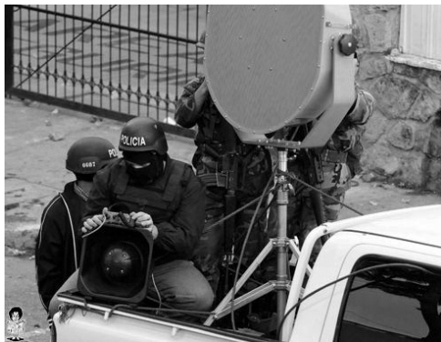
Screamer: tecnologia israeliana in dotazione alla polizia dell'Honduras

apparentemente innocua. Pochi attimi ed un suono assordante squarcia l'aria: la folla riottosa, in preda al panico, si tappa le orecchie e si contorce dal dolore. È l'ultima arma segreta in dotazione da tempo all'esercito israeliano, utilizzata pubblicamente dopo molti anni di sperimentazioni. Il "cannone sonico" appositamente pensato per disperdere grandi gruppi di persone, battezzato Screamer, è un dispositivo non letale in grado