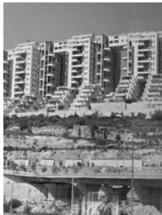
Sobborghi di Gerusalemme

Per Ram Karmi, uno dei più promettenti giovani architetti israeliani della seconda generazione di costruttori statali, «la ricerca dell'identità nazionale deve essere condotta attraverso l'architettura. Come non abbiamo creato una lingua ebraica dal niente ma l'abbiamo costruita sulle basi della lingua che parlavamo duemila anni fa allo stesso modo, mentre gli architetti investigavano la superficie del territorio, gli archeologi cercavano la storia ebraica nel sottosuolo». Alla fine il quartiere