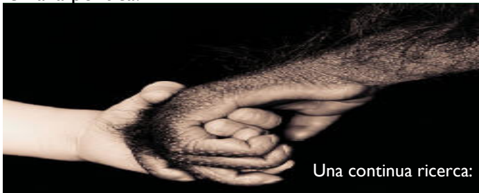
Una continua ricerca:

La ricerca: una continua ossessione dell'uomo. Il "sogno" della totale sottomissione della Terra ai propri voleri ed ambizioni ha portato in realtà alla totale sottomissione dell'uomo alle multinazionali ed alla politica.